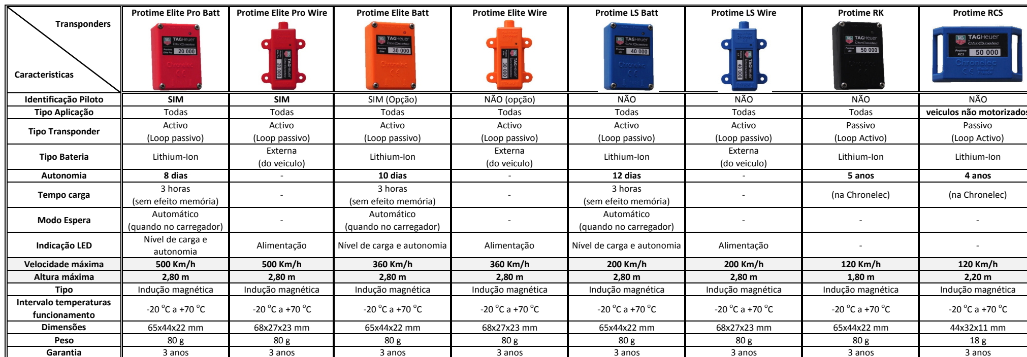
Tabela de Comparação de Transponders